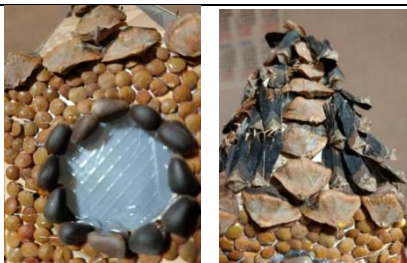
Рисунок 5. Рисунок 6.

Крышу украшаем чешуёй от кедровых и сосновых шишек (рис. 6)