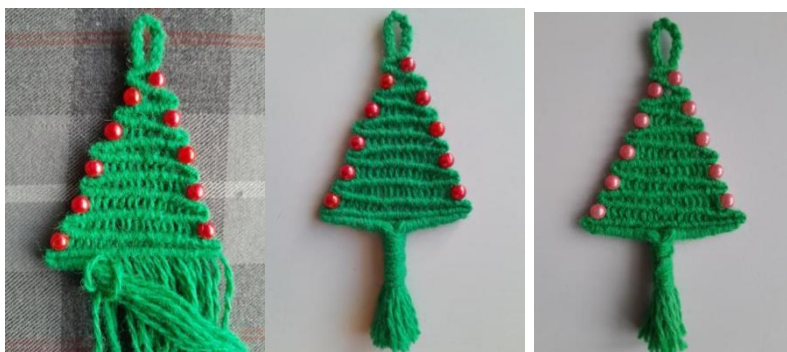
Рисунок 5.1 Рисунок 6.1 Рисунок 6.1