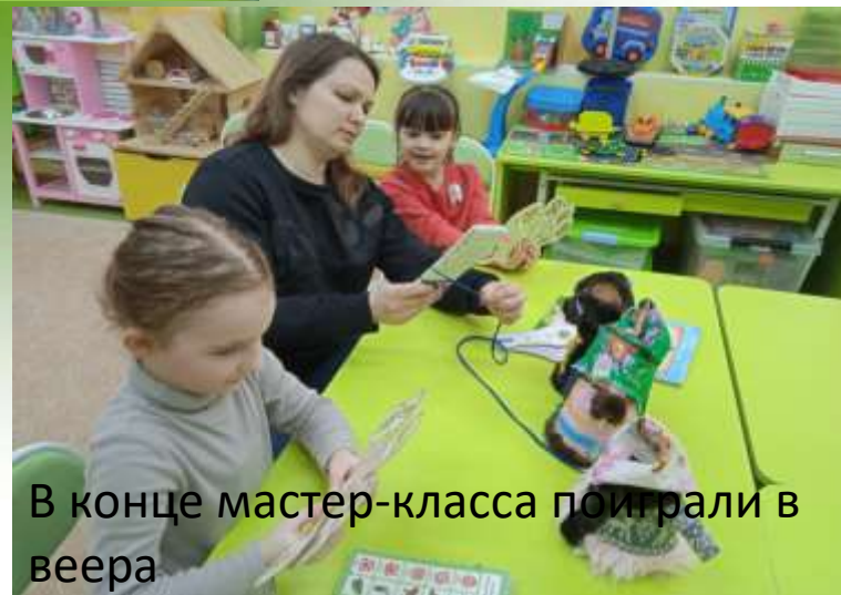
В конце мастер-класса поиграли в веера