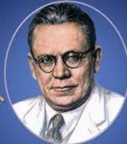
С.Я. МАРШАК 1887 - 1964