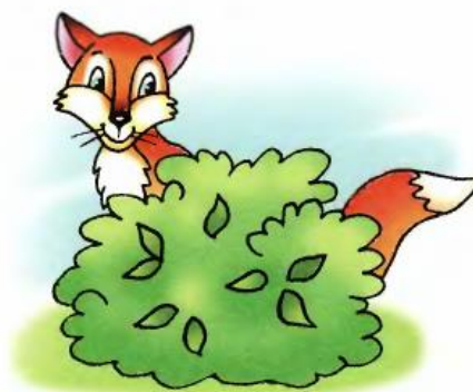
Лиса сидит за кустом.