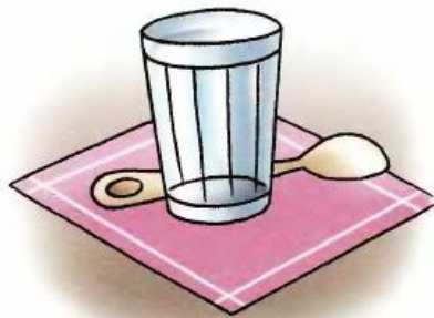
Ложка лежит за стаканом.