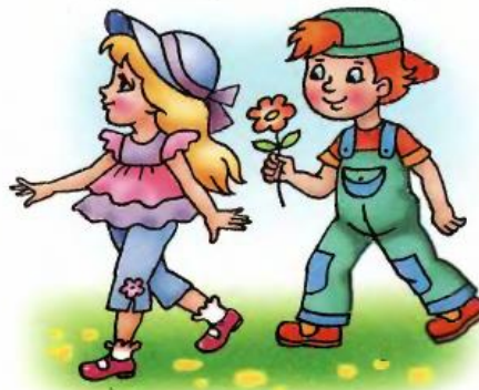
Мальчик идёт за девочкой.