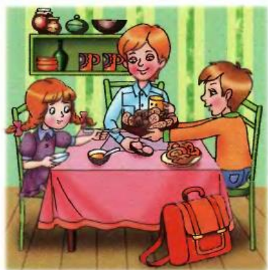
Дети сидят за столом.

5. Запомни предложения, закрой тетрадь и запиши их по памяти