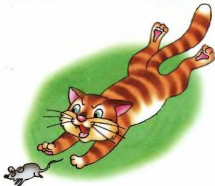
Кошка бежит за мышкой.