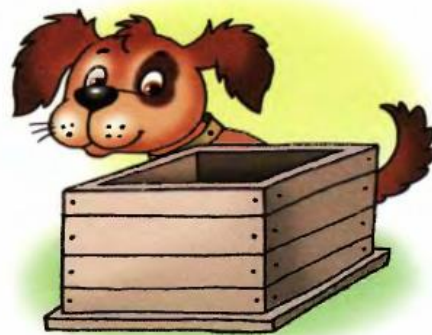
Щенок сидит за ящиком.