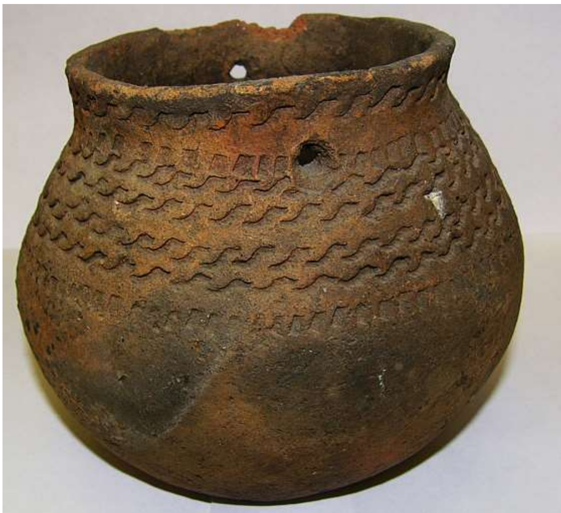
Керамика Кулайской культуры.