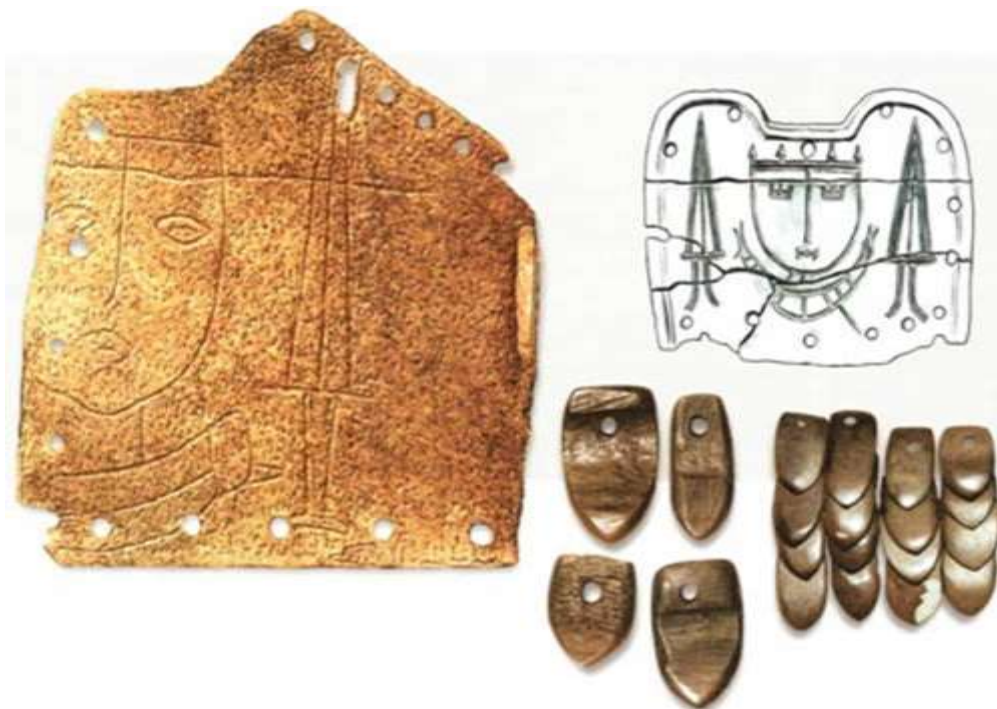
Слева-роговой нагрудник. сверху- нагрудник из китового уса, справа внизу- костяные чешуйки лат.