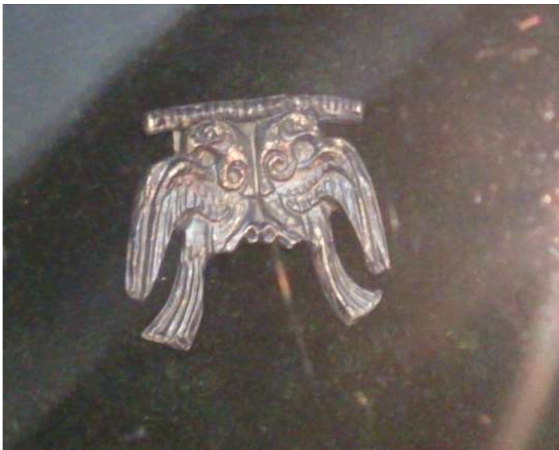
Фрагмент ожерелья из Микен, 16 в. до н.э.

Многочисленное оружие - крупные удлинённые трёхлопастные бронзовые и костяные наконечники стрел; железные наконечники копий; чеканы; бронзовые и биметаллические кинжалы, кельты (в том числе с узором в виде «уточек»); известны железные детали упряжи, роговые нагрудные пластины доспеха, украшенные гравированными изображениями (например, воин с кинжалом). Пряслица, каменные грузила рыболовных сетей, костяные ложки. Бронзовые ленты-диадемы, проволочные серьги с петелькой на конце, гривны, накосники, подвески, поясные застёжки, бусы (в том числе стеклянные и каменные), костяные орнаментированные гребни, в поздних комплексах - бронзовые эполетообразные застёжки, небольшие орнаментированные ножны.